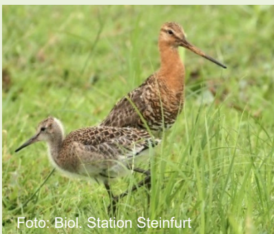
Adultes Tier mit Jungvogel

Sollte außerhalb von Naturschutzgebieten ein Hinweis auf ein Uferschnepfenbrutpaar gelingen, melden Sie dies bitte umgehend der Biologischen Station (Telefon: 0 54 82 / 92 91 0; E-Mail: info@biologische-station-steinfurt.de ) oder der uNB.