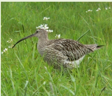
Adultes Tier

Keine direkte Nestersuche innerhalb von Naturschutzgebieten und sonstigen öffentlichen Flächen oder Flächen mit Bewirtschaftungsvertrag. Die Mitarbeitenden der Biologischen Station Steinfurt unterstützen bei Brachvogelgelegen, bitte nehmen Sie Kontakt (Telefon: 0 54 82 / 92 91 0; E-Mail: info@biologische-station-steinfurt.de ) auf.