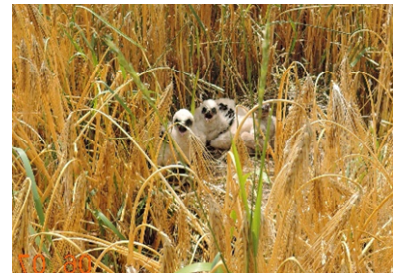
Rohrweihen-Nest in Wintergerste

Aussparung bei Bewirtschaftungsgängen: quadratisch 25 x 25 m um das Nest * (*sehr störungsempfindlichere Art)