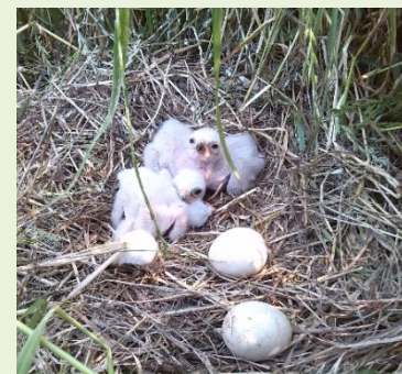
Rohrweihen-Gelege in Ackergras

Antrag & weiterführende Informationen unter: www.kreis-steinfurt.de/gelegeschutz