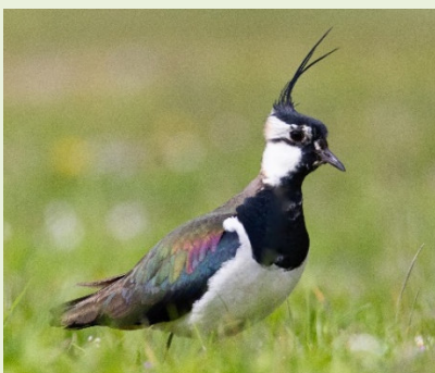
Adultes Tier

Ausnahme: Nach Rücksprache mit der Biologischen Station oder uNB kann ein Vollgelege (ab 4 Eiern) im Ausnahmefall max. 2 m in die benachbarte, bereits bearbeitete Spur versetzt werden, damit sie weiterbrüten - nicht weiter weg! Dafür ist es nötig, dem Kiebitz das Nest in der bereits bearbeiteten Spur "nachzubauen": Mit der Handfläche eine neue Nestmulde in die Erde drücken, mit kleinem Einstreumaterial etwas auspolstern und die Eier einzeln und sehr vorsichtig wieder dort hineinzulegen.