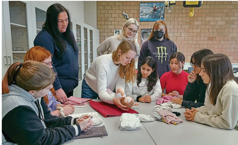
Schülerinnen der Caritas-Pflegeschule Rheine waren in die Schule am Bagno gekommen, um den Schülerinnen und Schülern dort zu vermitteln, wie die Ausbildung verläuft und welche Aufgaben mit dem Beruf der Pflegefachleute verbunden sind.

der Stadt bedeutsam sind. Beginn ist um 9.30 Uhr, Ende gegen 12.30 Uhr. Die Veranstaltung findet in der Familienbildungsstätte an der Schulstraße 3 in Borghorst statt.