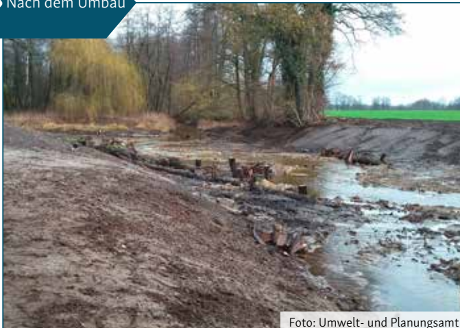
Nach dem Umbau