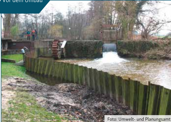
Vor dem Umbau