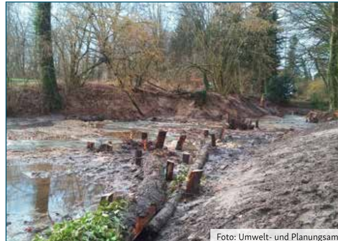
Raugerinne mit Störsteinen (Blick stromaufwärts)