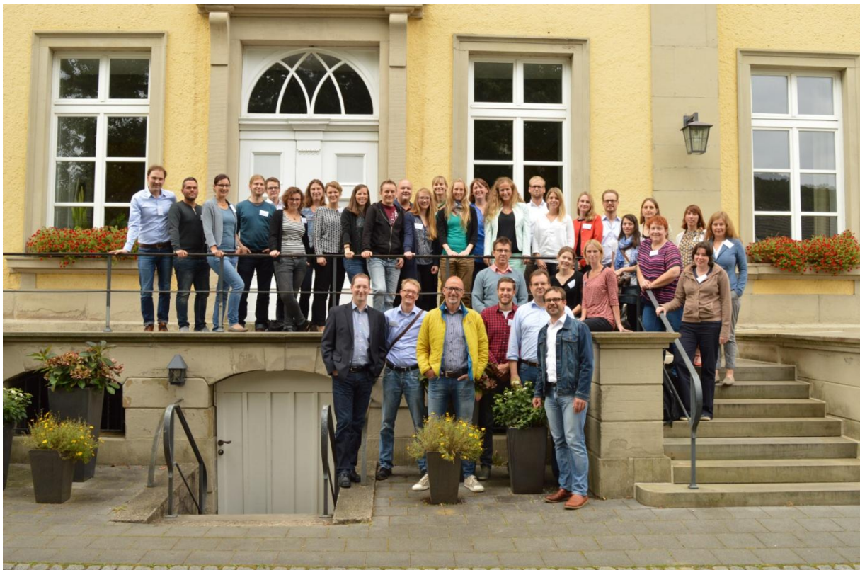
Gruppenfoto: Regionalmanager-Netzwerktreffen der 28 LEADER-Regionen in NRW