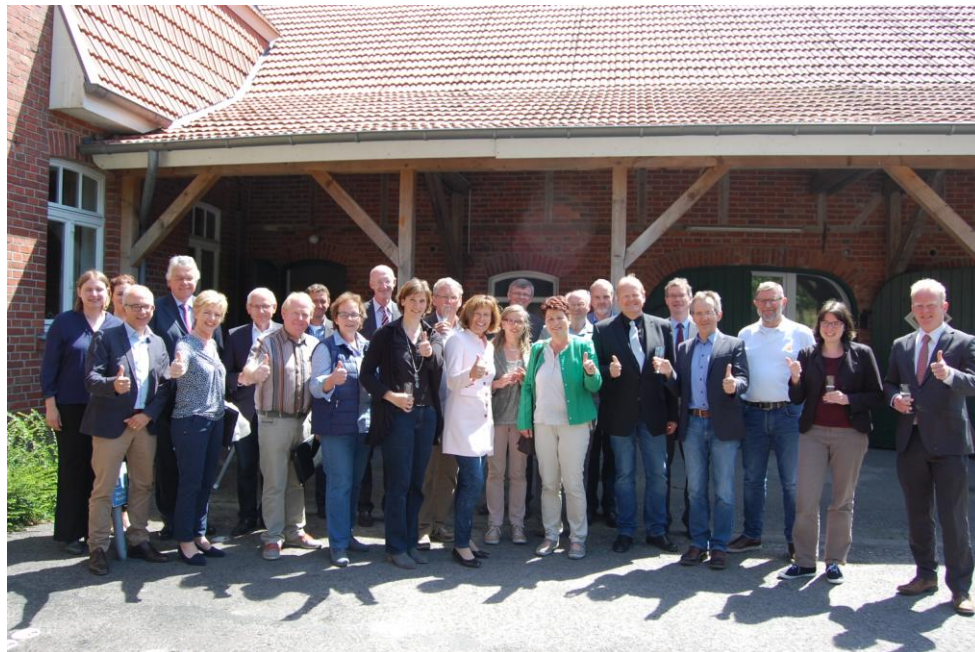
Gruppenfoto der Mitgliederversammlung vom 15.06. 2015 am Denkmalpflegewerkhof