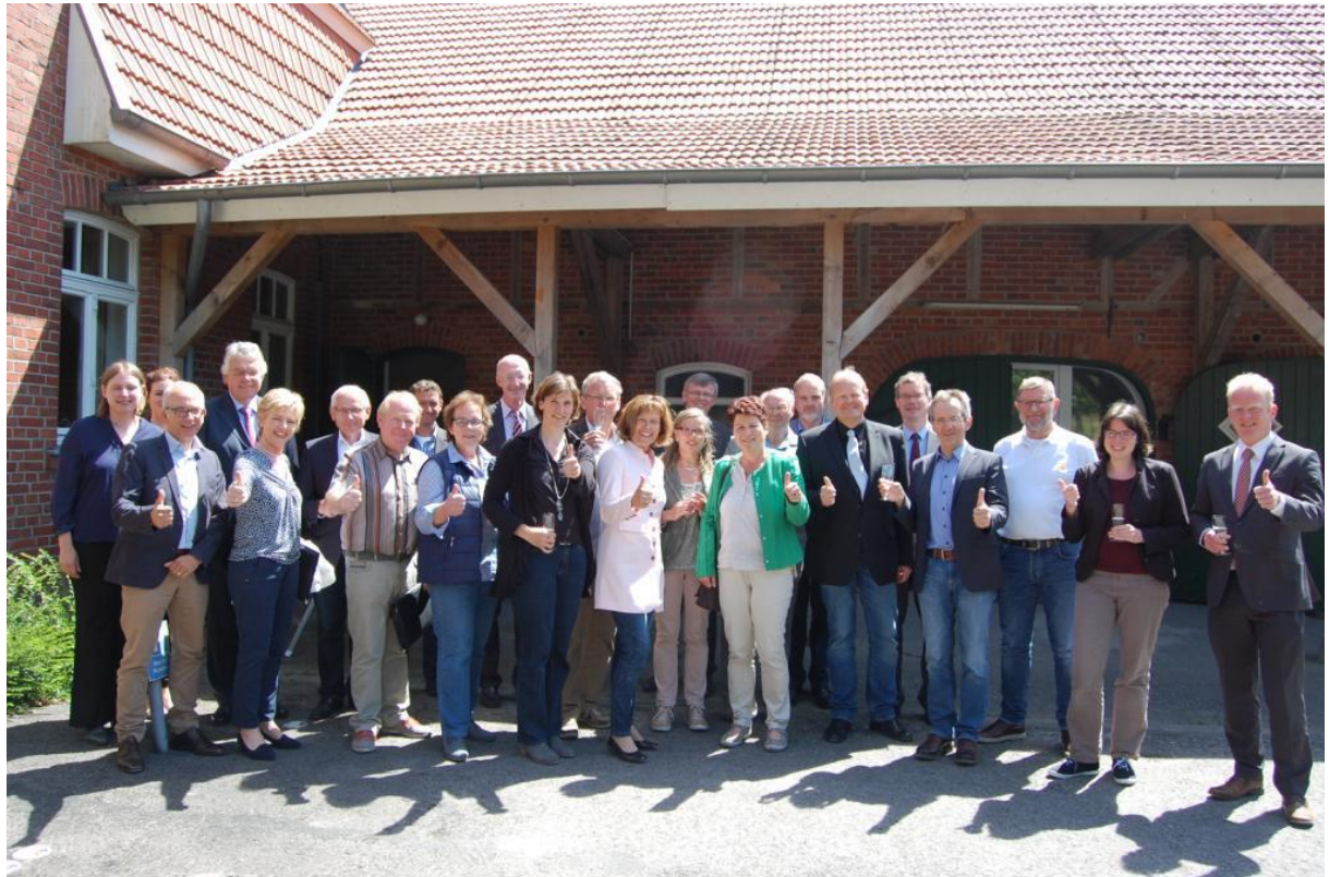
Foto der Mitgliederversammlung vom 15. 06. 2015