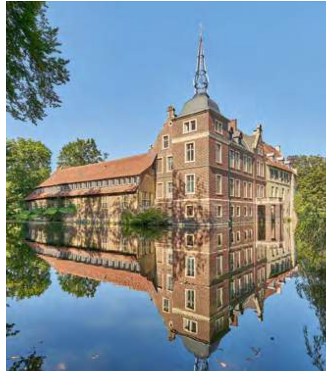
Schloss Senden: Aus der spätmittelalterlichen Burganlage wurde ein repräsentatives Wasserschloss.

Natur lieben. Blaue Anwesen – „die Privaten“ – sind oft noch bewohnt und nicht begehbar. Umso mehr bereichern sie aber am Wegesrand eine Rad- oder Reittour und können mit Abstand betrachtet werden. Die Schlösser und Burgen im Münsterland bieten so viel Interessantes für viele unterschiedliche Menschen: vom kleinen Ritterfan bis zum versierten Geschichtsliebhaber, von der Architekturfreundin bis zum Naturgenießer. Für euch alle gibt es hier Programm-Highlights: Mitmachaktionen für Kinder, Architektur-, Kunst- und Schauspielführungen, Konzerte und Klang-events, Lyriklesungen, Ausstellungen, Kunstinstallationen, Picknickevents und vieles mehr.