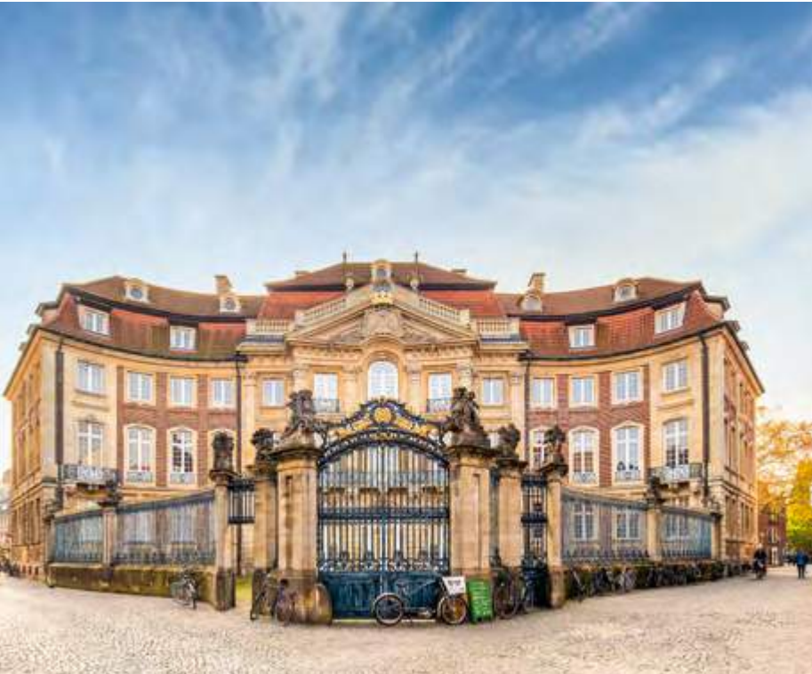
Erdrostenhof: von Johann Conrad Schlaun erbautes Adelspalais im Herzen von Münster