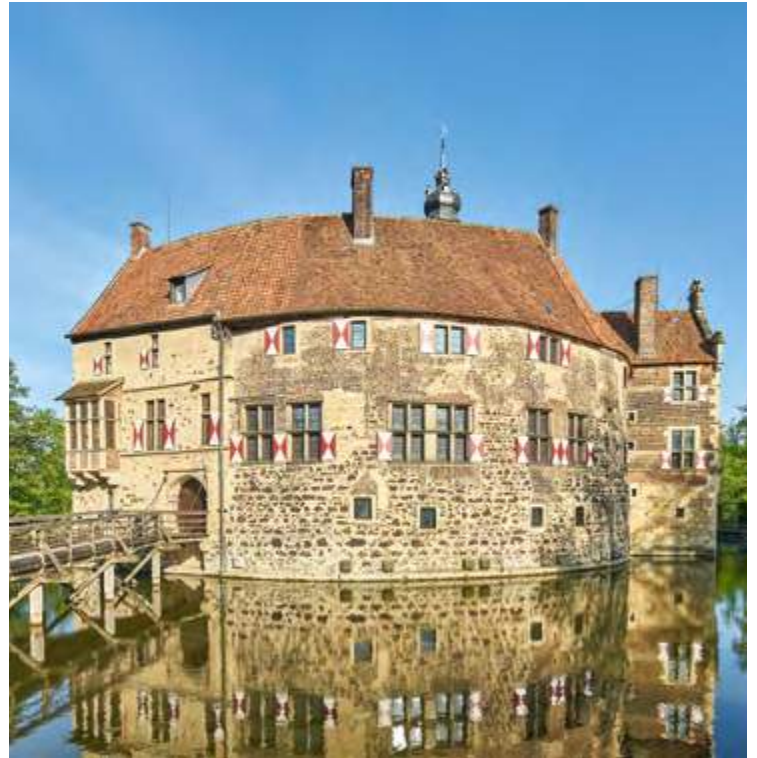
Burg Vischering: das Ideal einer münsterländischen Wasserburg

Es ist diese große Vielfalt, die die Schlösser- und Burgenregion Münsterland so außergewöhnlich und abwechslungsreich macht. Nirgendwo sonst findest du solch eine Dichte an Wasserschlössern und -burgen, die oftmals noch von Nachfahren der ursprünglichen Erbauern bewohnt werden. Hier wird Geschichte gelebt und weitererzählt – und das kannst du bei deinem Besuch hautnah erleben.