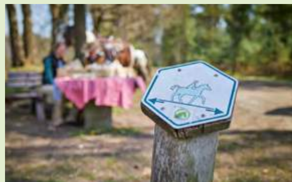
Auf der Münsterland-Reitroute weisen dir sechseckige Schilder den Weg.