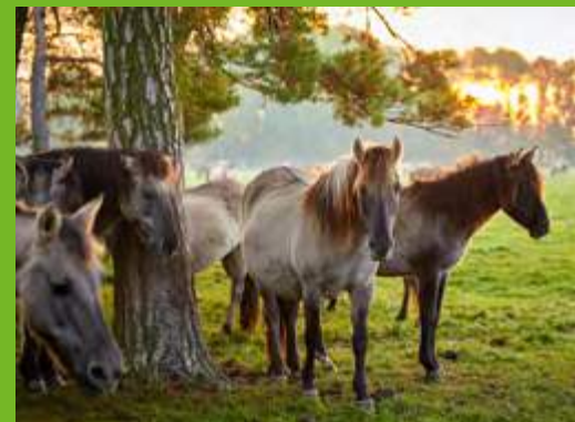
Die Wildpferde sollen ohne Hilfe zurechtkommen.