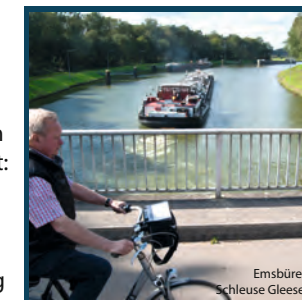
Emsbüren: Schleuse Gleesen