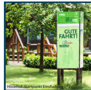
Hövelhof: Startpunt EmsRadweg