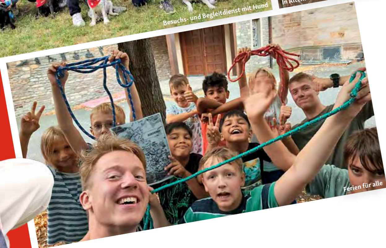
Ferien für alle