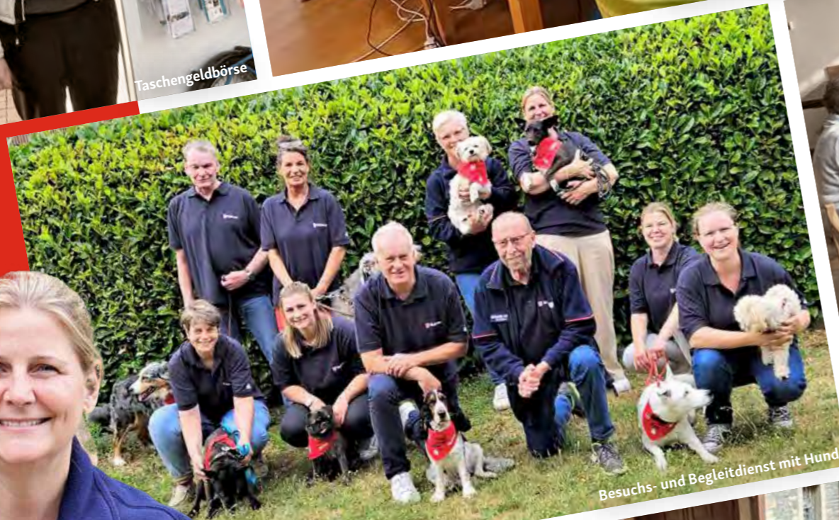
Besuchs- und Begleitsdienst mit Hund