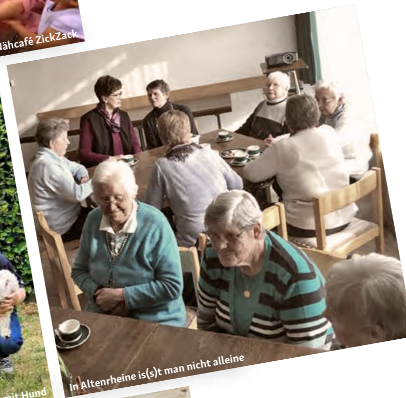
In Altenrheine is(s)t man nicht alleine