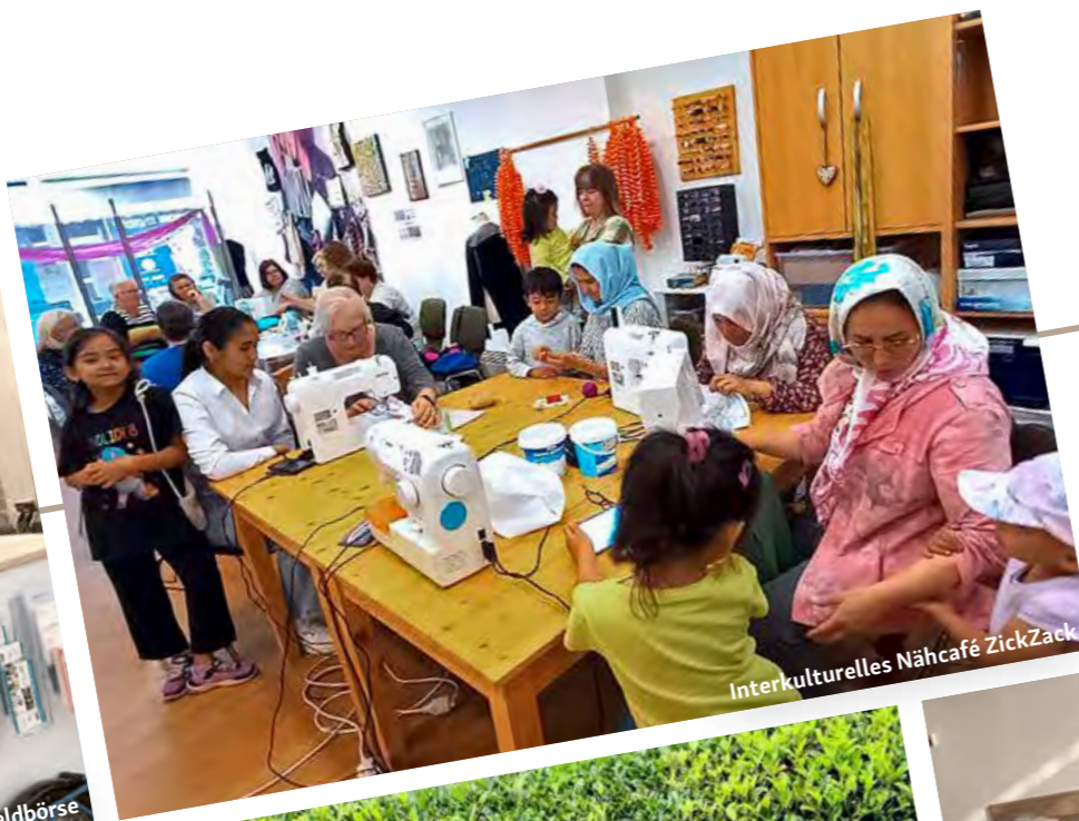
Interkulturelles Nähcafé ZickZack